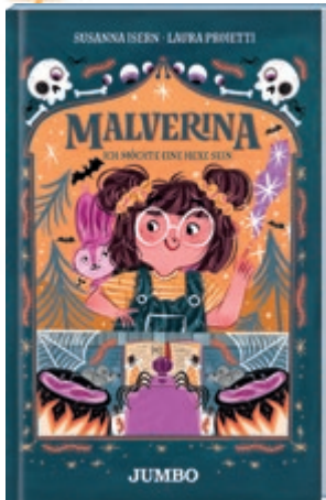
ISBN 978-3-8337-4503-4 120 Seiten · durchgehend farbig illustriert