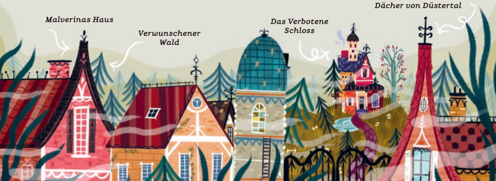
Dächer von Düstertal